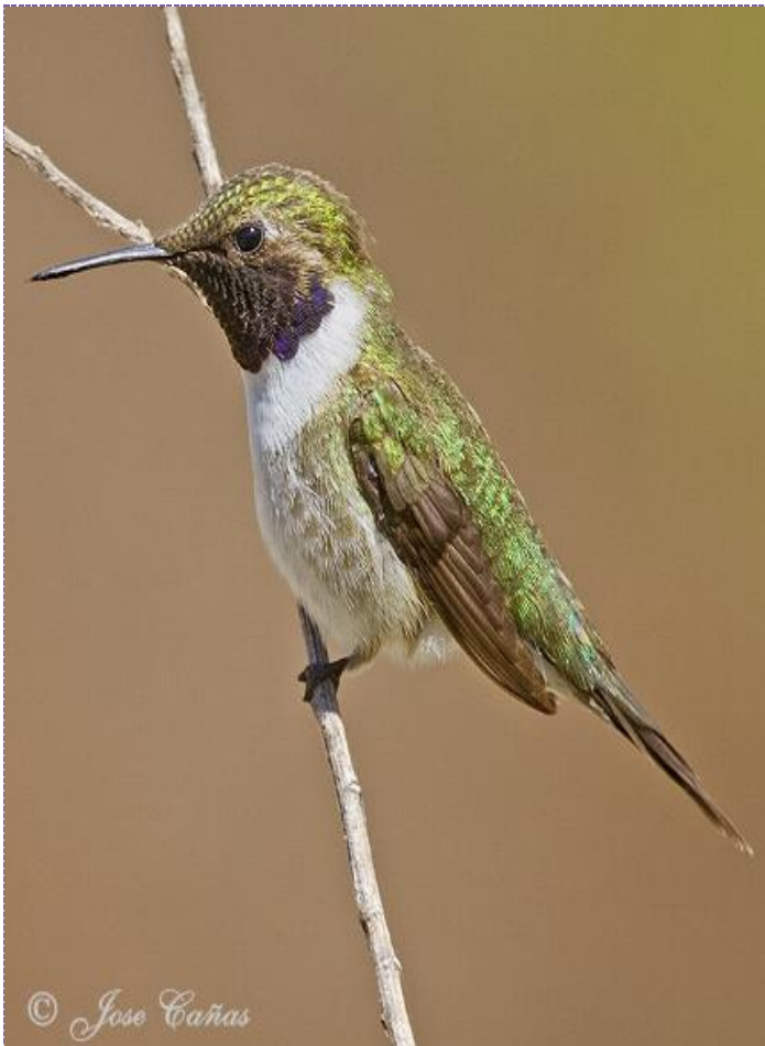
Picaflor de Arica Macho