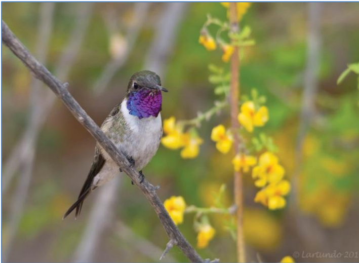
Picaflor de Arica