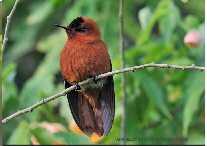
Picaflor de Juan Fernández